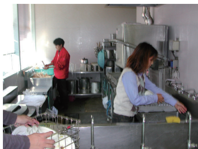
↑ 皿の洗浄風景

お皿を環境資源委員会から店舗さんにお貸しします。お客さんが使用されたお皿はメインストリートに設置された回収箱に置かれるか、店舗に返却することで、回収します。