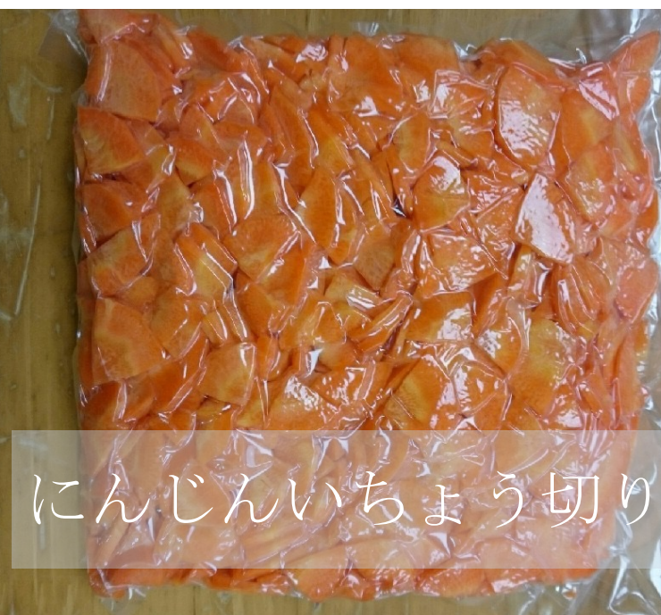
にんじんいちょう切り