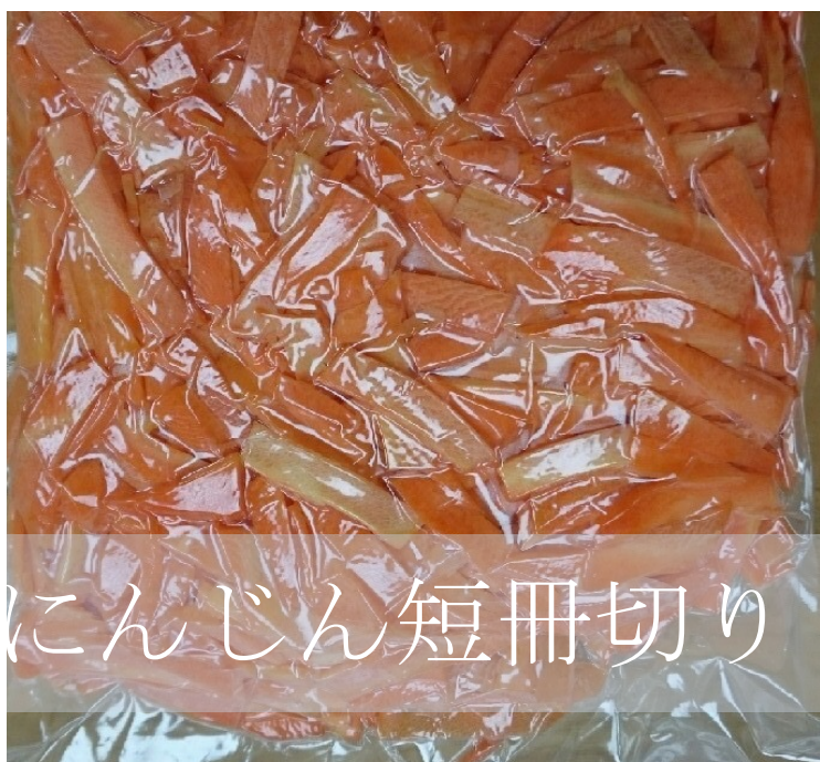
にんじん短冊切り