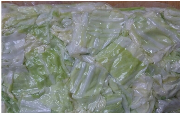
キャベツ四方切り